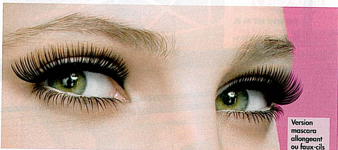
Version mascara allongeant ou faux-cils époustouflants, à vous de rendre votre regard glamour.