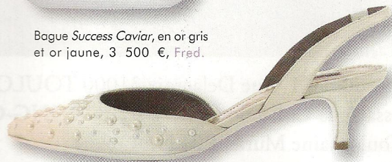
Chaussure Pearla , en satin de soie et perles de cristaux de Swarovski, 445 € la paire, Vouelle.