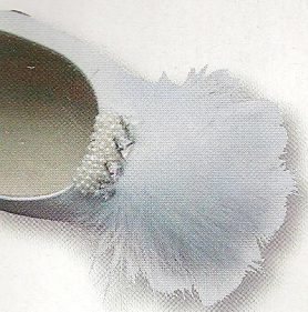
Clips d'escarpins, composés de plumes blanches, strass de Swarovski et perles naturelles, fait main, 90 € la paire, Dominique Hauswirt.