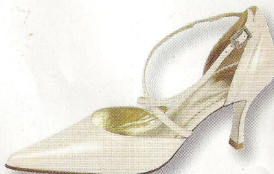
Chaussure en cuir, 120 € la paire, Une Fille à marier.