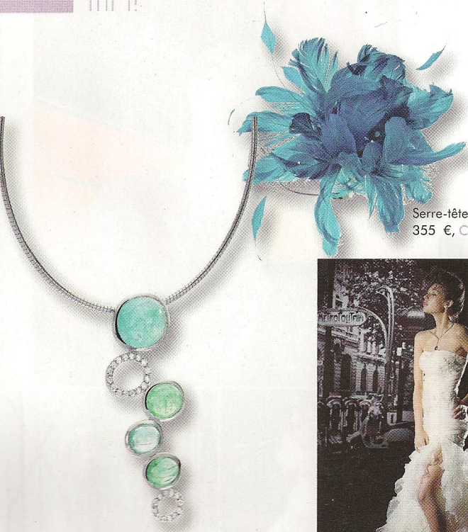
Collier Blue Lagon , en or blanc avec tourmaline de Paraiba et diamants, 3 150 €, H. Gringoire.