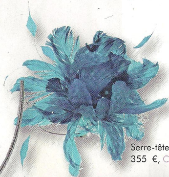
Serre-tête orné d'une fleur, 355 €, Cherry Chau.