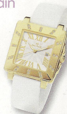
Montre Rhapsody , avec boîtier plaqué or jaune et pierres de cristal, 180 €, Folli Follie.