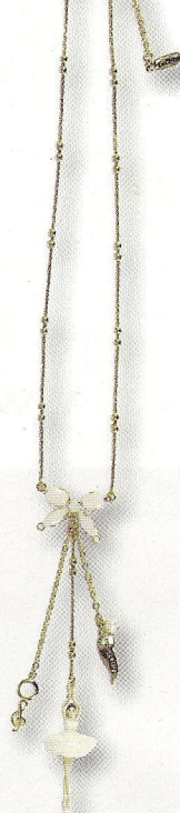
Collier Pas de deux , en métal émaillé, perles d'eau douce, de verre et de cristal de Swarovski, 95 €, Les Néréides.