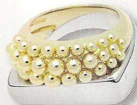
Bague Success Caviar , en or gris et or jaune, 3 500 €, Fred.