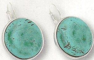
Boucles d'oreilles, 48 €, Ubu.